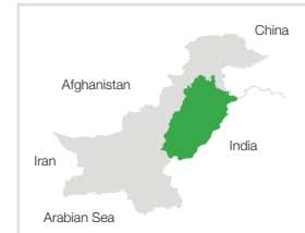
Processed & Prepared by: PPAF GIS Laboratory